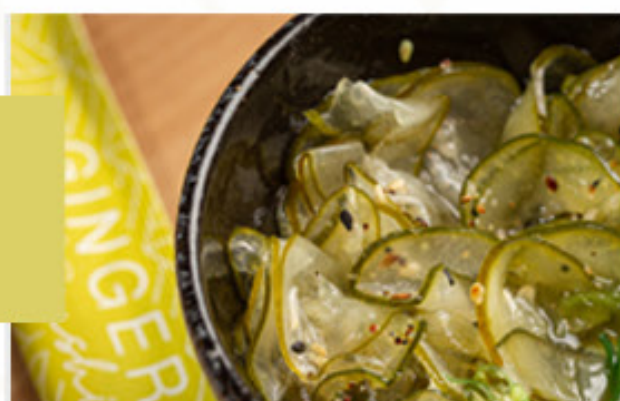
SALADA DE PEPINO AGRIDOCE