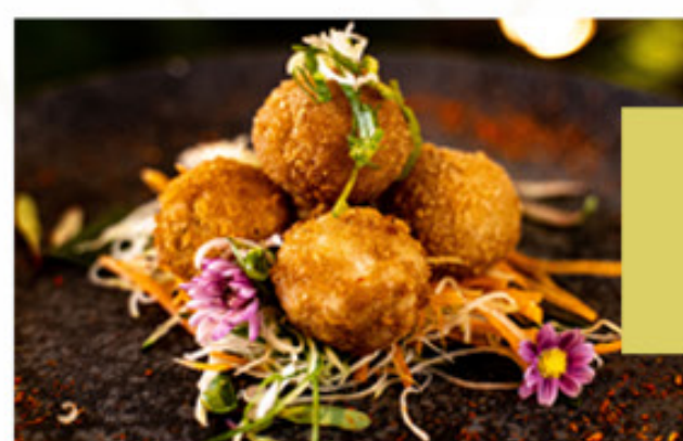
GYOZA SUÍNA FRITA