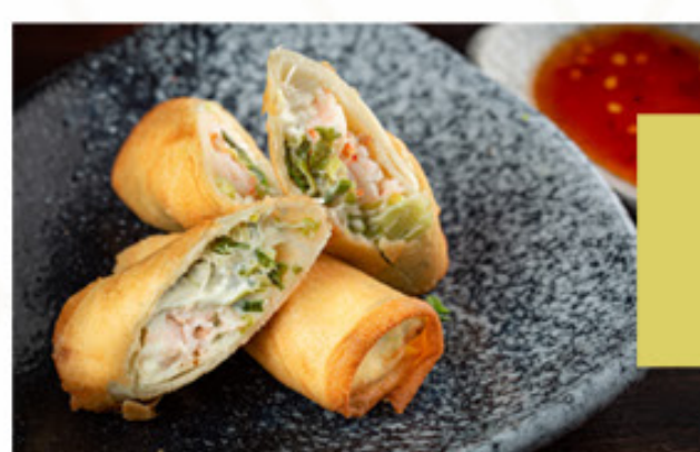
HARUMAKI DE CAMARÃO, SALMÃO, QUEIJO OU LEGUMES